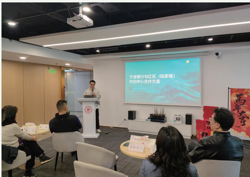
▲ 宁波银行上海分行联合举办红瓦投融资特训班

针对科创企业不同生命周期，宁波银行上海分行打造了差异化产品矩阵。如面向研发密集型企业的“薪资贷”，以工资总额预核授信额度；面向获投后6个月内企业的“伙伴贷”，解决初创企业“有技术无资产”的痛点；面向首批量产订单交付期客户的“订单贷”，凭里程碑订单预授信，加速产业化进程。