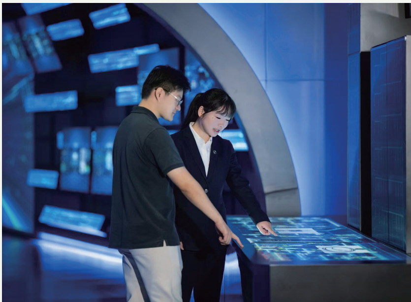
▲ 上海农商银行为科技型民营企业定制解决方案，创造专业化、多元化专属价值

模式支持民营企业经营发展的积极探索。作为典型的连锁经营业态，酒店行业加盟商众多且均为民营企业，新开业企业无报表信息，资金需求“短小频急”，传统融资模式难以有效覆盖。针对加盟商筹建期和运营期物资采购的融资需求，上海农商银行与锦X集团量身定制了全线上流程、纯信用、全国覆盖的融资方案，对于新店还提供延期还本付息政策，切实降低民营小微经营者的融资门槛与资金压力。未来，上海农商银行将持续深入上海市重点产业链板块，通过智慧供应链平台实现供应链核心模式与脱核模式并重发展的局面，精准触达助力更多民营经营主