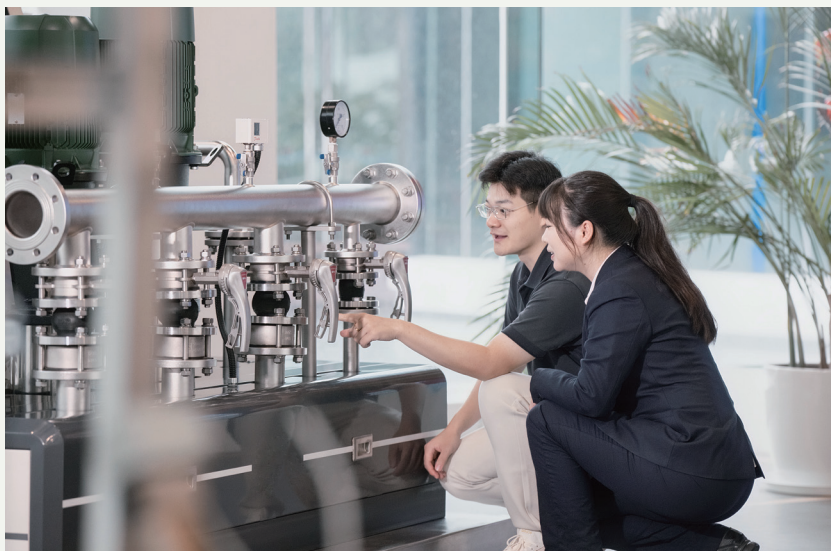
▲ 上海农商银行客户经理走访民营企业，提供全面、高效、优质支持

与中建 X 局的顺利合作，是上海农商银行应用智慧供应链“核心”模式批量解决民营企业融资需求的典型实践。中建 X 局是国内最具竞争力的大型综合投资建设集团之一，建筑项目涵盖机场、体育场馆、文化旅游、城市综合体、市政路桥、环保水务等。在中建 X 局延伸业务版图、布局长三角一体化过程中，其上游大量供